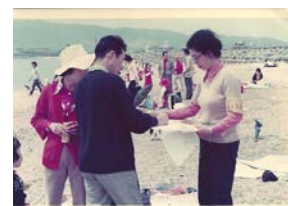
保護区指定への署名活動

母親たちの甲子園浜埋立公害反対運動は住民運動となり、昭和50年「甲子園浜の埋立を考える会」が結成されていました。昭和51年4月には、西宮市庁舎の市長室前で主婦たちが埋立に反対して座り込みを始めていました。同年5月「考える会」では「甲子園浜を鳥獣保護区」に指定して欲しいとの請願書を一万二千人の署名とともに国会へ提出しました。環境庁(当時)に甲子園浜を残して欲しいと訴えたのです。請願