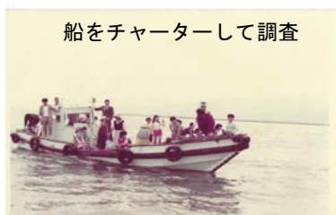
船をチャーターして調査

戦前から海水浴場として知られた甲子園浜は、工場や家庭の排水によって、夏には赤潮で醤油色、臭気もあり、昭和40年香櫨園浜とともに海水浴禁止となっていました。それも埋立促進の理由となりました。で