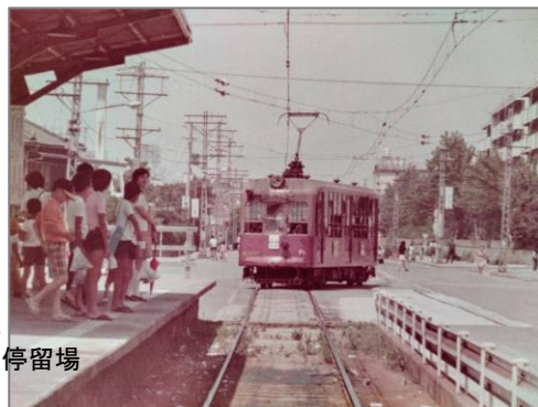
浜甲子園団地 148 号棟 149 号棟 解体前